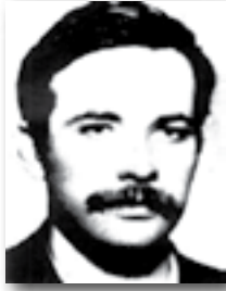
MAHİR ÇAYAN 1946 Samsun